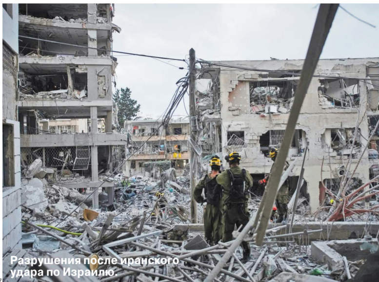
Разрушения после иранского удара по Израилю.