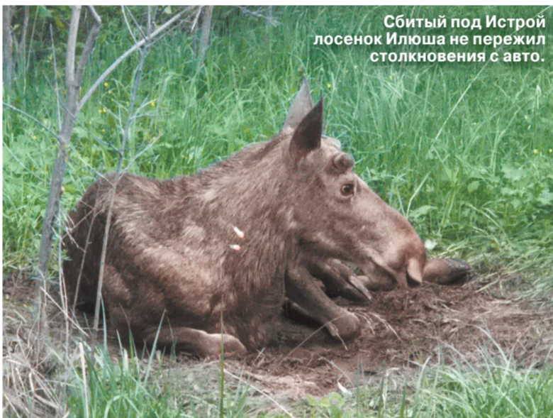
Сбитый под Истрой лосенок Илюша не пережил столкновения с авто.