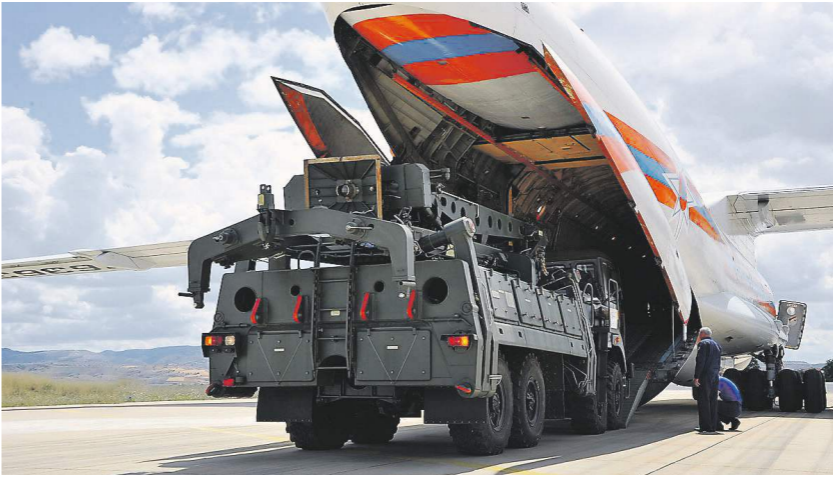
Партия компонентов С-400 выгружается на авиабазе Мюртед под Анкарой

Компоненты С-400 доставляются в Турцию в строгом соответствии с условиями контракта и в согласованные сроки, заявили «Известиям» в Минобороны. С-400 является новейшей системой ПВО и предназначена для