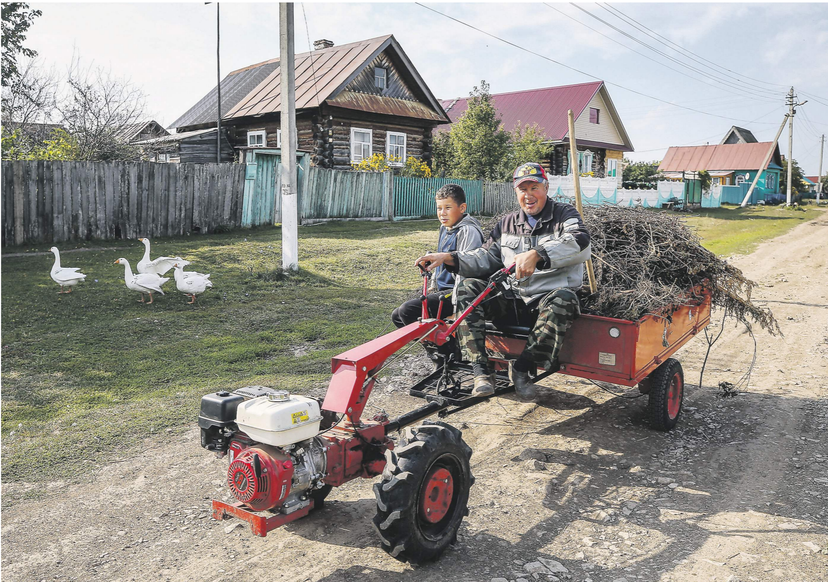
Соцконтракт позволяет получить деньги на развитие подсобного хозяйства