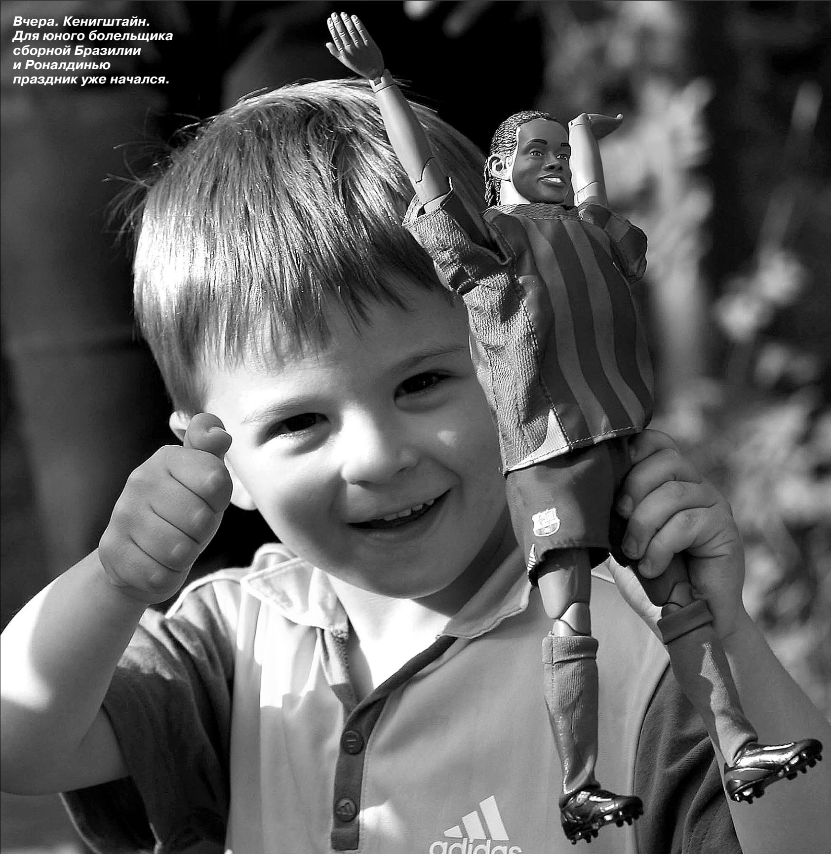
Александр ФЕДОРОВ «СЭ»

Вчера, Кенигштайн. Для юного болельщика сборной Бразилии и Роналдиньо праздник уже начался.