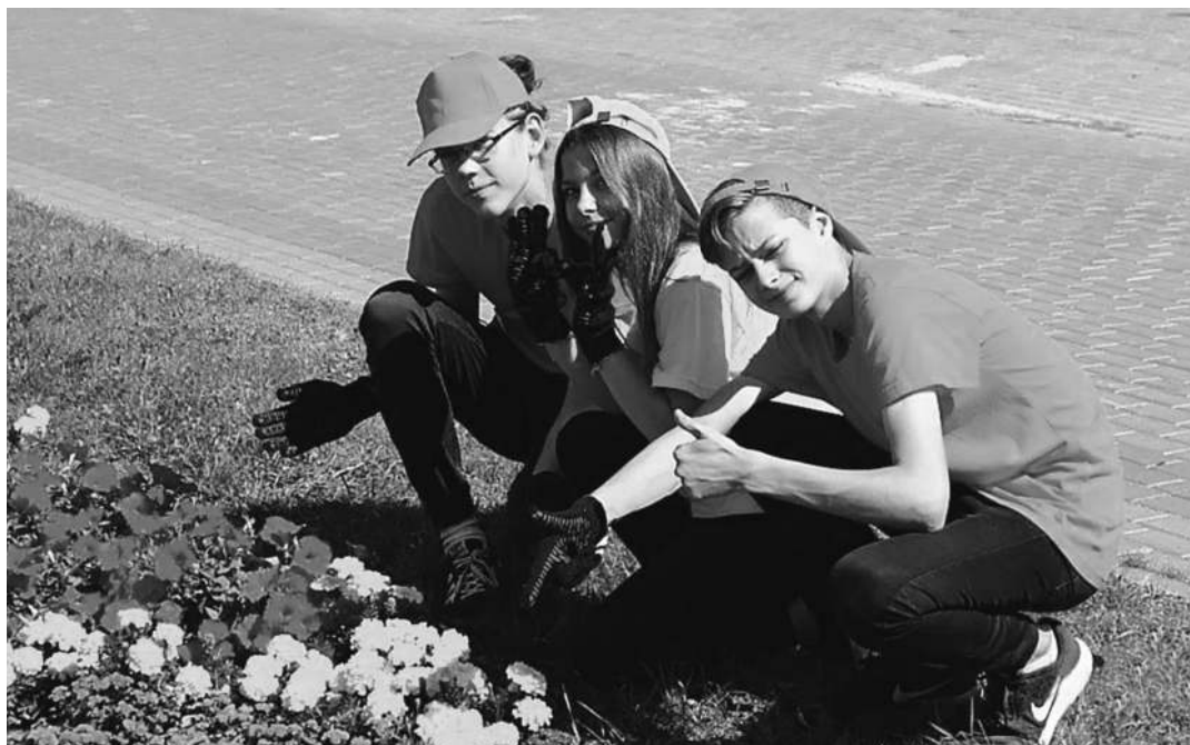
СЛУЖБА ЗАНЯТОСТИ АСТРАХАНСКОЙ ОБЛАСТИ

Этим летом в Севастополе трудоустроят более 2100 подростков в возрасте от 14 до 17 лет. Им предложат около 10