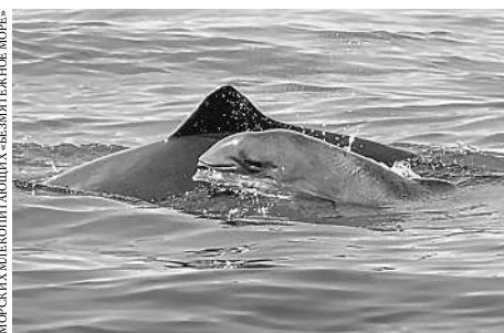
ЦЕНТРИЗУЧЕНИЯ, СПАСЕНИЯ И РЕВІТАЛІЗАЦІЇ МОРСЬКИХ АЛІОПІОЮЩИХ «ВІЗМЯТНЕ МОРЕ»

Дельфин азовка может развивать скорость до 22 километров в час.