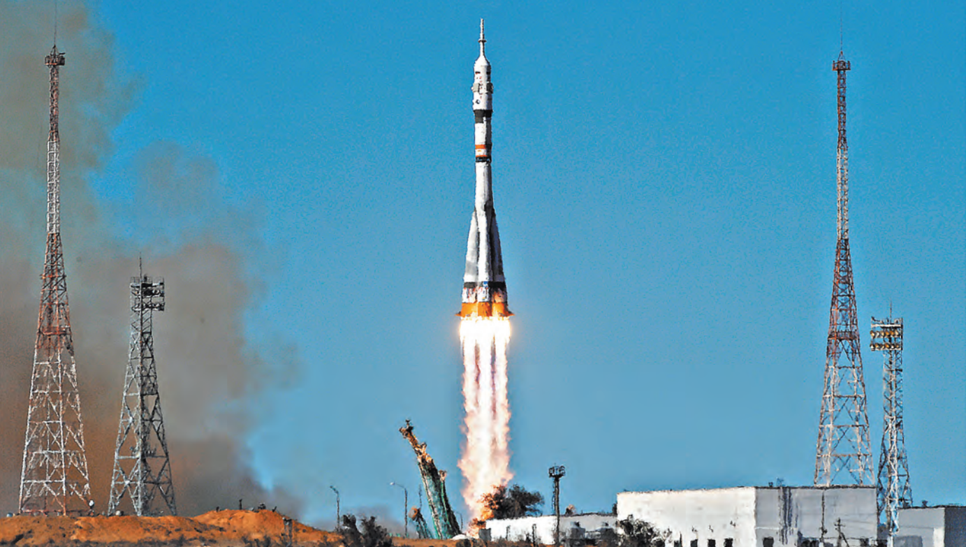
Космодром Байконур, 11.55 мск. Пуск ракеты-носителя «Союз-2.1а» с пилотируемым кораблем «Союз МС-19».

В 15.12 мск «киноэкипаж» причалил к модулю «Рассвет» российского сегмента МКС. Фантастика. До космической станции, как на электричке до Калуги. Правда, здесь тоже пришлось поволноваться: начала сбывать автоматика, поэтому решили не рисковать и перейти на ручное управление. Специалисты, безусловно, разберутся, в чем дело. «Ситуация штатная. Для этого и существует резервная система, возможности ручного управления, и для этого мы обучаем командиров, чтобы они справились с этой задачей», — подчеркнул глава Роскосмоса Дмитрий Рогозин.