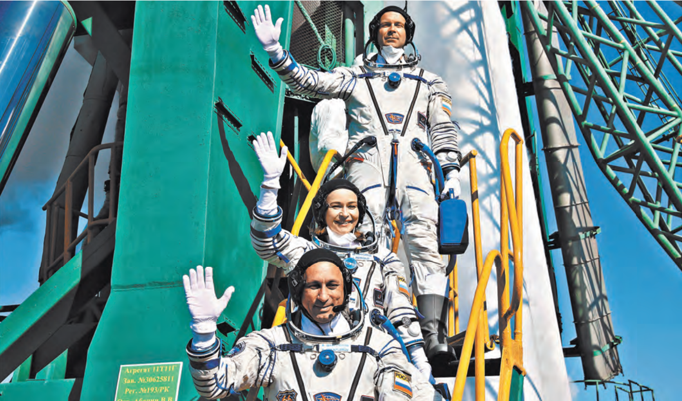
Через три с небольшим часа полета первый в истории киноэкипаж причалил к Международной космической станции.

...То, что произошло на Байконуре, видел весь мир. Вот экипаж выходит из автобуса и направляется к ракете. Все в мажорном ключе. Но, как заметили, актриса с очень симпатичным макияжем. У каждого в руках — маленький чемоданчик. Что там? Оказывается, это пе-