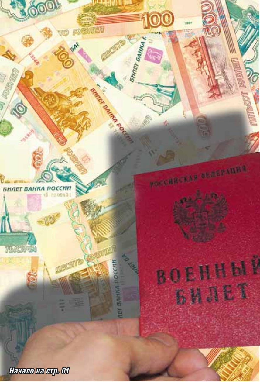
Начало на стр. 01

Принятый в 2011 году закон № 306-ФЗ «О денежном довольствии военнослужащих и предоставлении им отдельных выплат» должен был сформировать новую стройную систему вознаграждения за исполнение служебных обязанностей и стать финансовой основой для создания профессиональной армии. Что же получилось на деле?