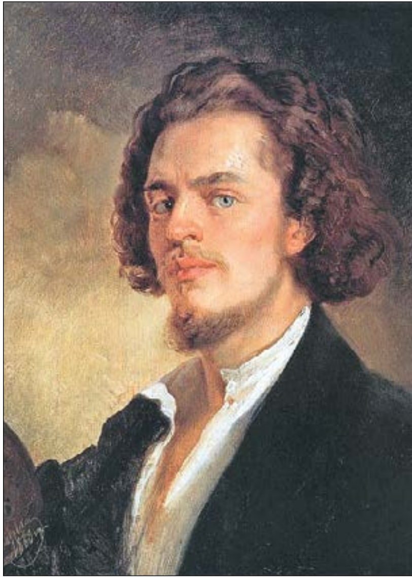
Работы художника: «Портрет отца», «Дети, бегущие от гроз», «Счастливые гадания» и «Автопортрет»

Красивый человек красив во всём – так и хочется перефразировать известную формулу, как только видишь облик и многочисленные работы Константина Маковского, и сейчас удивляющего и радующего зрителя своим художническим мастерством и эстетическим вкусом. «Если кто из художников был популярен на Руси – то это именно он. На него, быть может, не молились, его не называли богом, но его все любили, и любили самые его недостатки – то самое, что сближало художника со своим временем» – так отзывался о своём современнике А. Бенуа. Но были у художника и завистники – как свидетельство таланта, известности, семейного счастья с тремя красавицами-жёнами, славы, богатства, обеспеченных высокооплачиваемыми заказчиками, в числе которых и члены императорской фамилии. Будущий академик рос в атмосфере известного в 1840-е на всю Москву салона, где бывали драматург А. Островский, художники С. Зарянко,