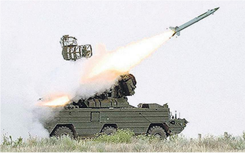
«Тор» не промахнётся!

Донецкой Народной Республики. Противник потерял свыше 240 военнослужащих, восемь автомобилей и три орудия полевой артиллерии, в том числе два производств стран НАТО. Уничтожены станция радиоэлектронной борьбы «Квертус» и шесть складов боеприпасов.