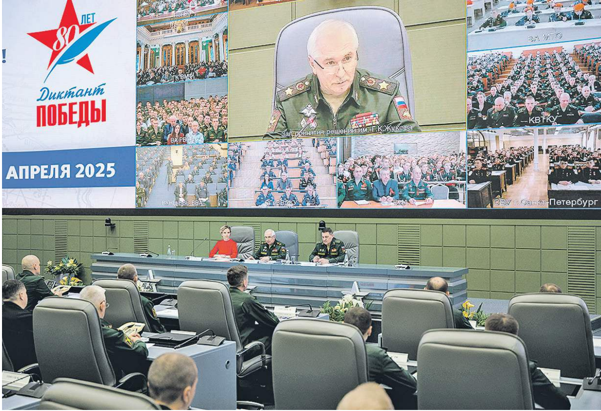
Главная площадка проведения акции — зал принятия решений имени Г.К. Жукова.

Всего было развернуто 712 площадок в воинских частях и на кораблях, в лодовозских образовательных организациях, военных вузах, органах военного управления, учреждениях и организациях Минобороны России, на которых были проведены тематические