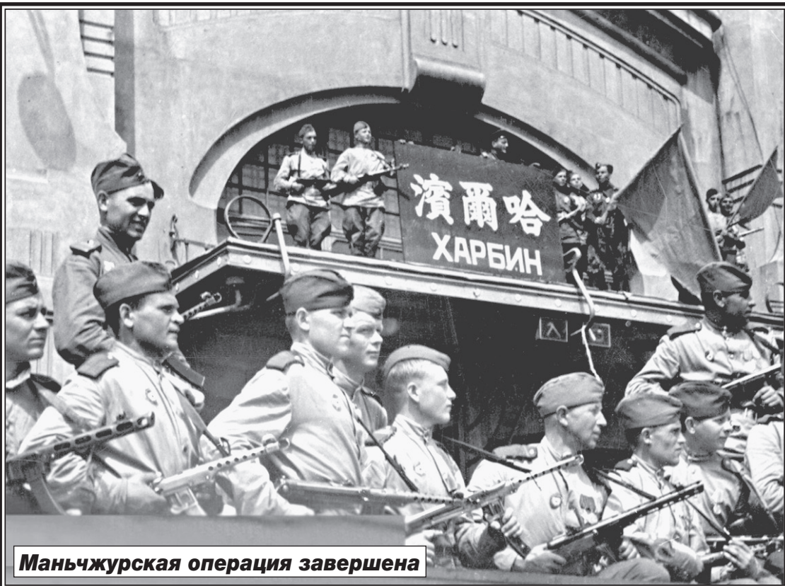
Маньчжурская операция завершена