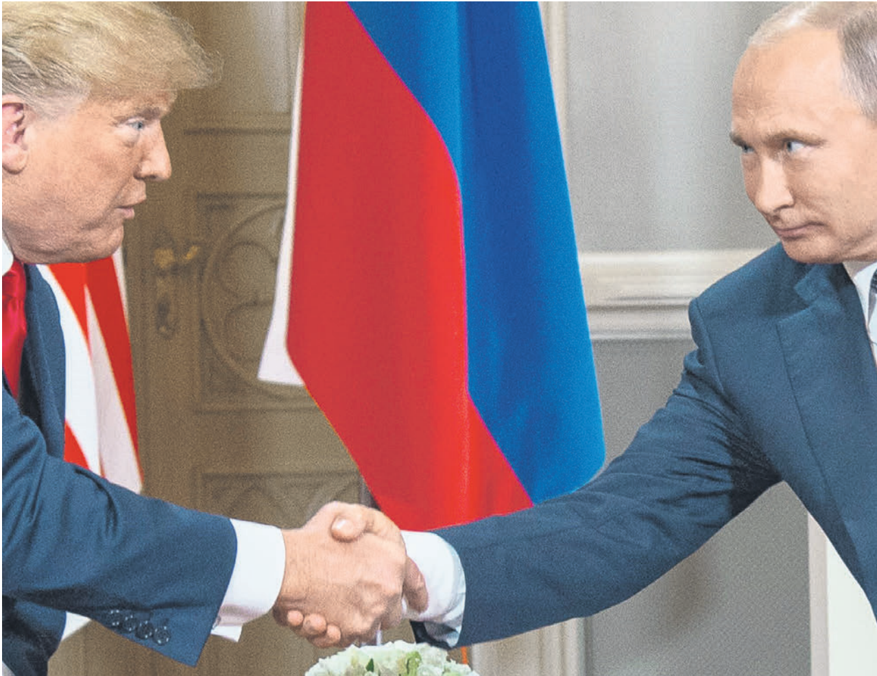
Когда-то было вот так. И 12 февраля 2025 года было уже почти так же

— Совсем недавно завершился телефонный разговор президента Путина и президента Соединенных Штатов