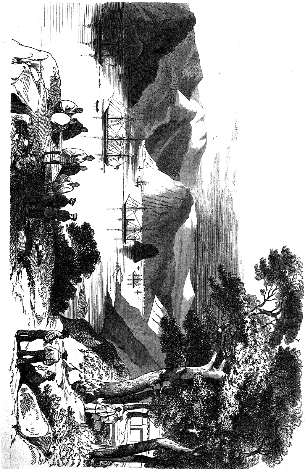
Simoda von Hamabata Fluss gesehen.