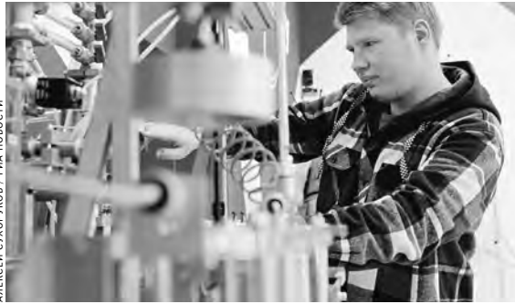
Разработки предприятий получают серьезные средства для внедрения.

Главная цель проекта — поддержка научно-исследовательской и инновационной деятельности на территории области. Всего на субсидию в 2023 году предусмотрено 24 миллиона рублей, что в два раза больше, чем в прошлые годы. Конкурс проводится в девятый раз. В этом году условия расширяются. Организации могут привлекать к реализации проектов научные коллективы вузов, научных учреждений страны. Ранее ограничивались только научными коллективами региона. С 2015 года участниками конкурсного отбора стали 73 организации региона, из них 28 получили субсидию НИОКР на общую сумму 59 391 тысяча рублей.