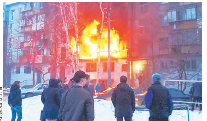
Огонь повредил квартиры сразу на трех этажах.