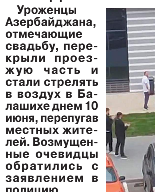
Танцы возле подъезда невесты.

Свадьба в Азербайджане, отмечавшаяся в Москве, перекрыла проезжую часть, гости стали стрелять в воздух в 10 июня, перепугав местных жителей. Возмущенные очевидцы обратились с заявлением в полицию.