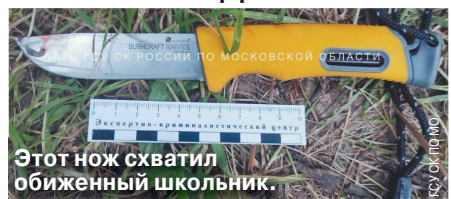
Этот нож схватил обиженный школьник.

10-летний школьник ударил ножом своего 12-летнего товарища во время туристического слета в Коломенском городском округе 10 июня. Ребята поссорились из-за прически.