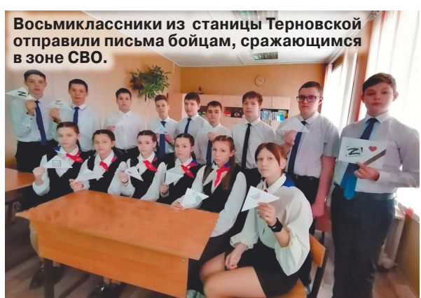
Восьмиклассники из станции Терновской отправили письма бойцам, сражающимся в зоне СВО.