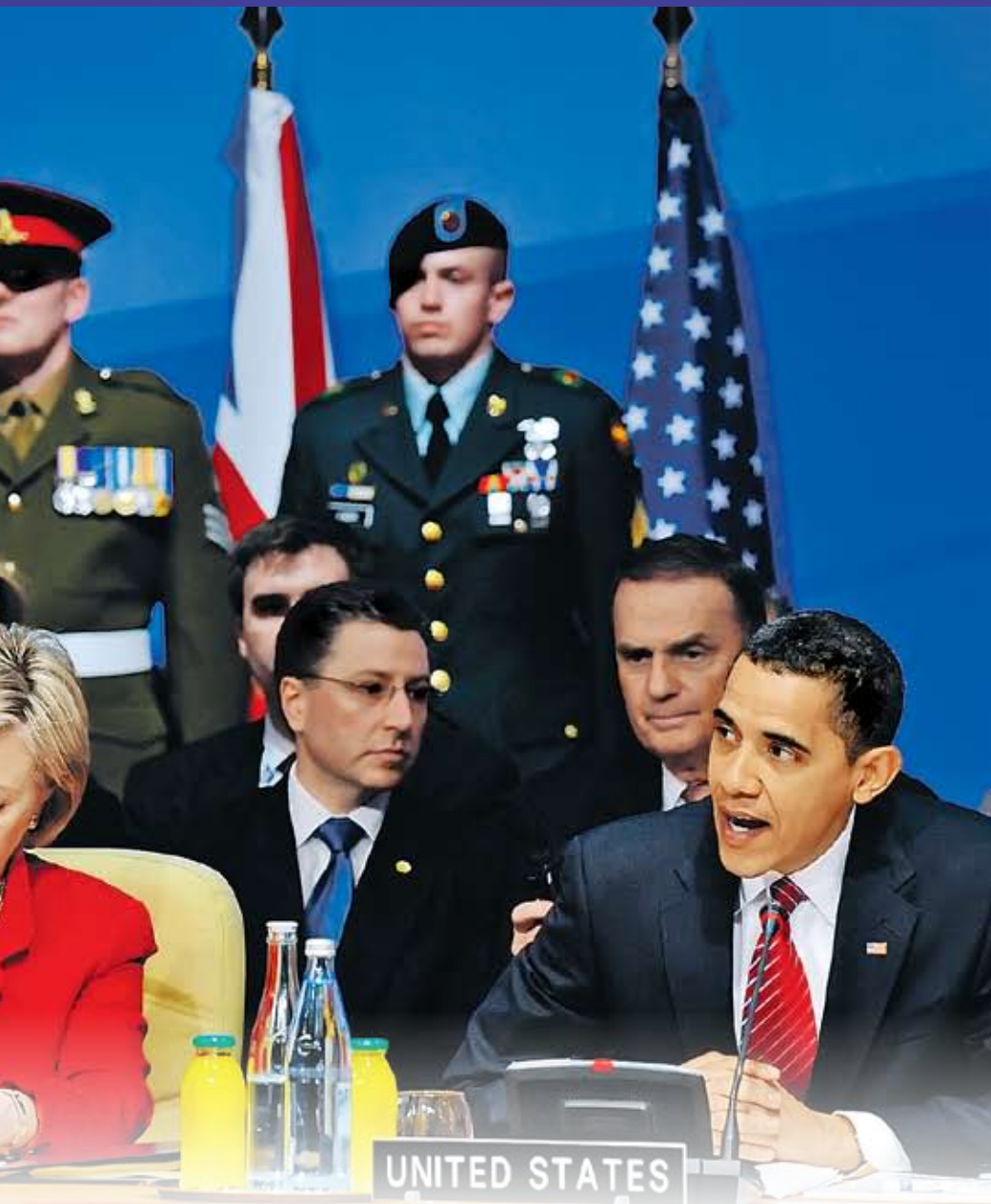
Коллаж: Андреа СЕДЬХ

В данной связи необходимо четкое понимание тех причин, которые сделали нынешнее «преобра-жение» Саакашвили возможным. Не менее важно и осознание вероятных последствий его «второго ды-хания». Не будем забывать, что первое напрямую привело к событиям «горячего августа» 2008 года. Говоря о нынешнем всплеске политической ак-тивности грузинского лидера, известный британский эксперт Томас де Ваал назвал Саакашвили «волшеб-ником Мишей». Что имел в виду политолог? По его словам, «два года назад, после поражения в авгу-стовской войне почти все, кто наблюдал за события-ми, считали дни, которые остаются Саакашвили до окончания его пребывания на президентском посту. Сегодня он снова беспорный лидер Грузии». В самом деле, как бы мы ни относились к пер-соне грузинского лидера, практически все социоло-гические исследования фиксируют рост его попу-