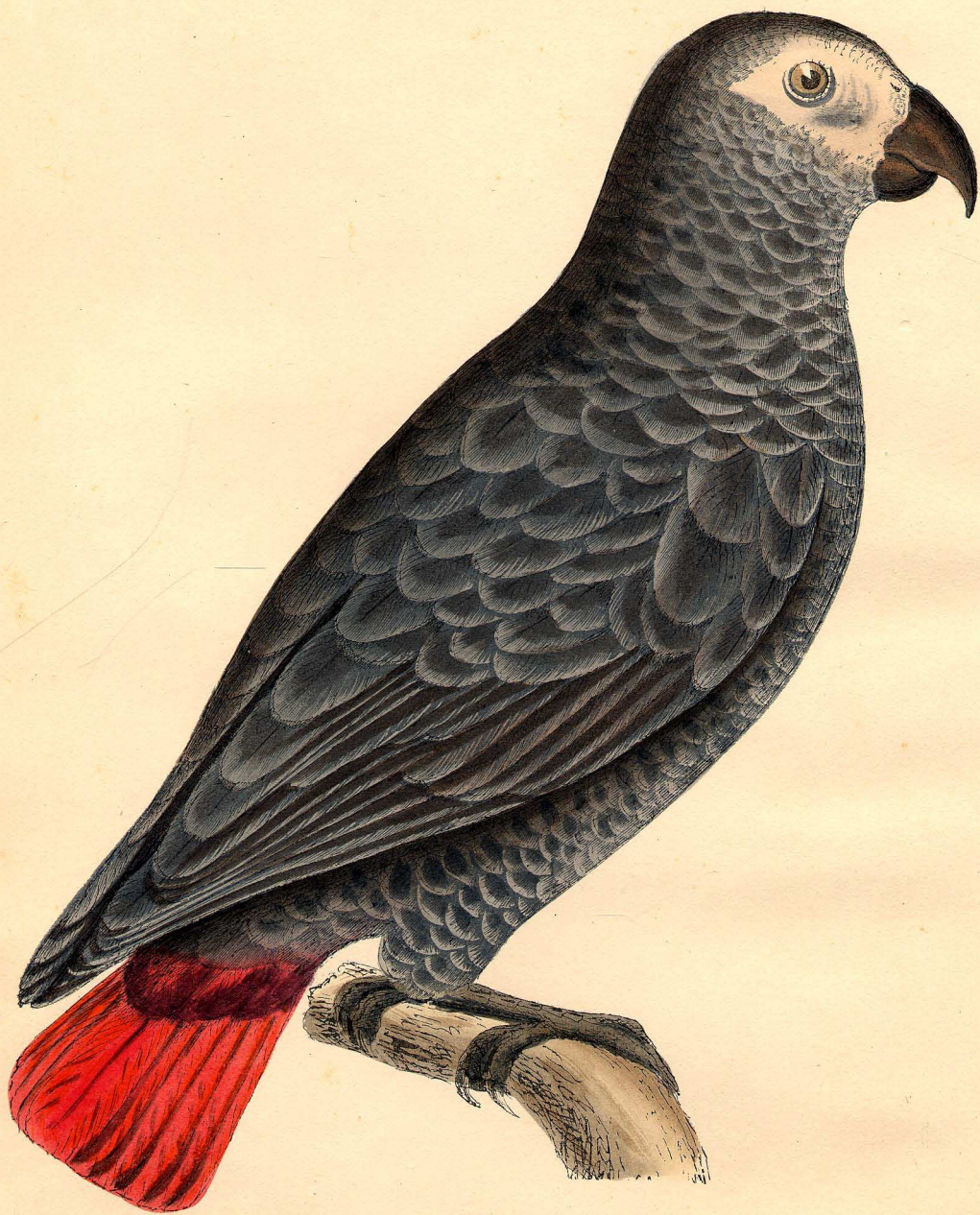
PL. I.—PERROQUET GRIS— Psittacus erythacus