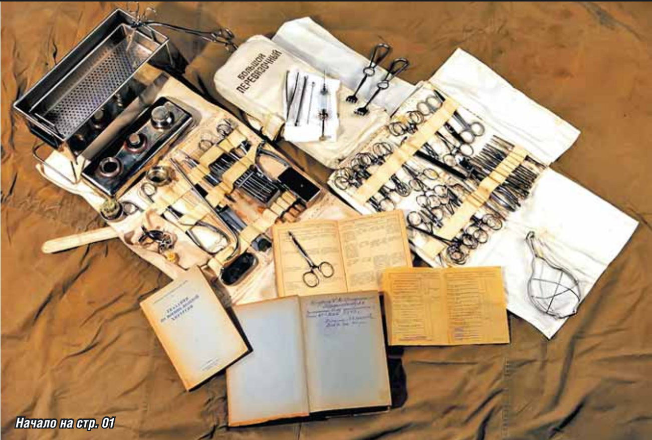
Начало на стр. 01