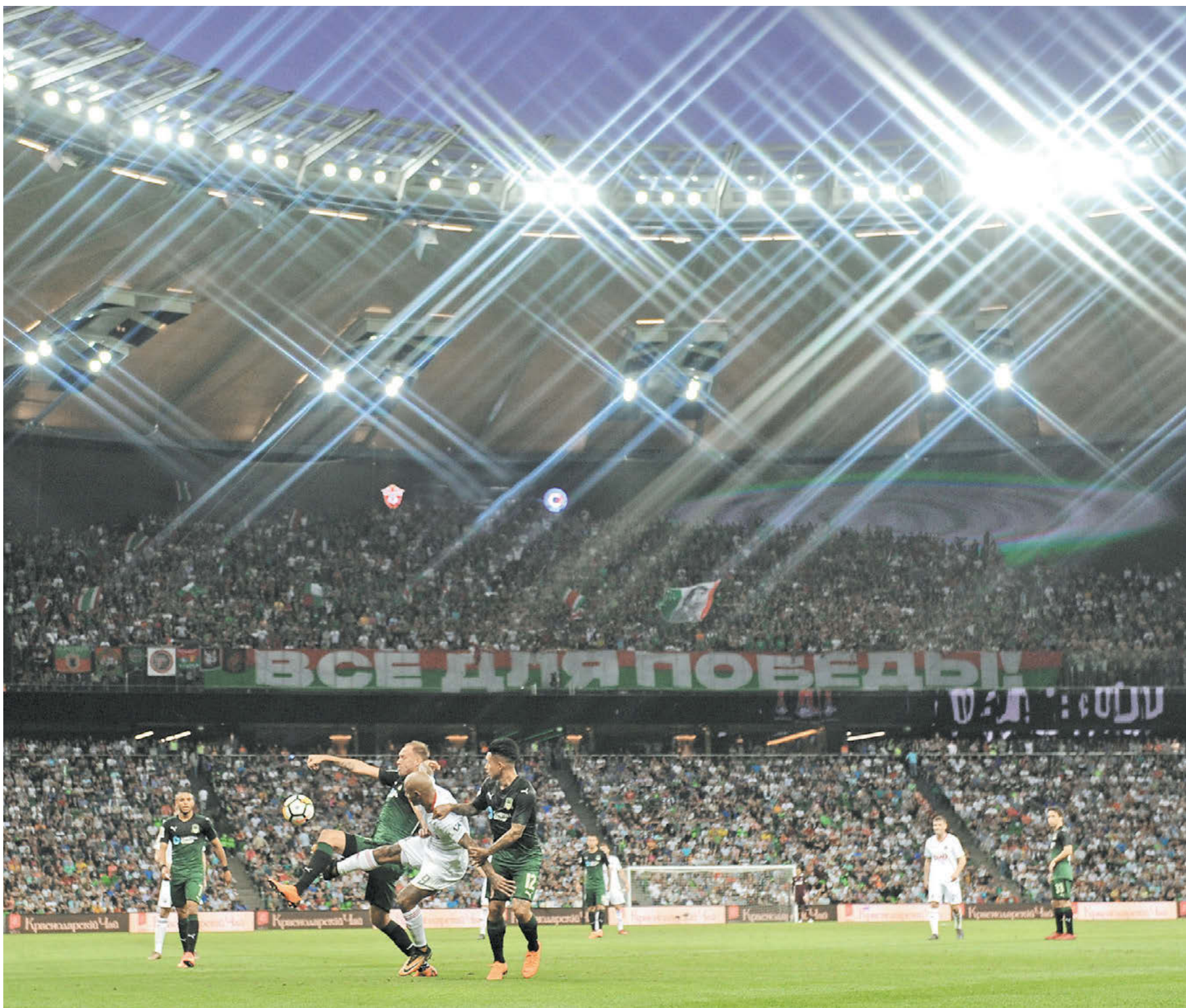
За российское футбольное золото будут биться не 16, а 18 команд

Вчера состоялось общее собрание премьер-лиги. Главное решение – большинство клубов проголосовало за увеличение числа участников РПЛ с 16 до 18 команд