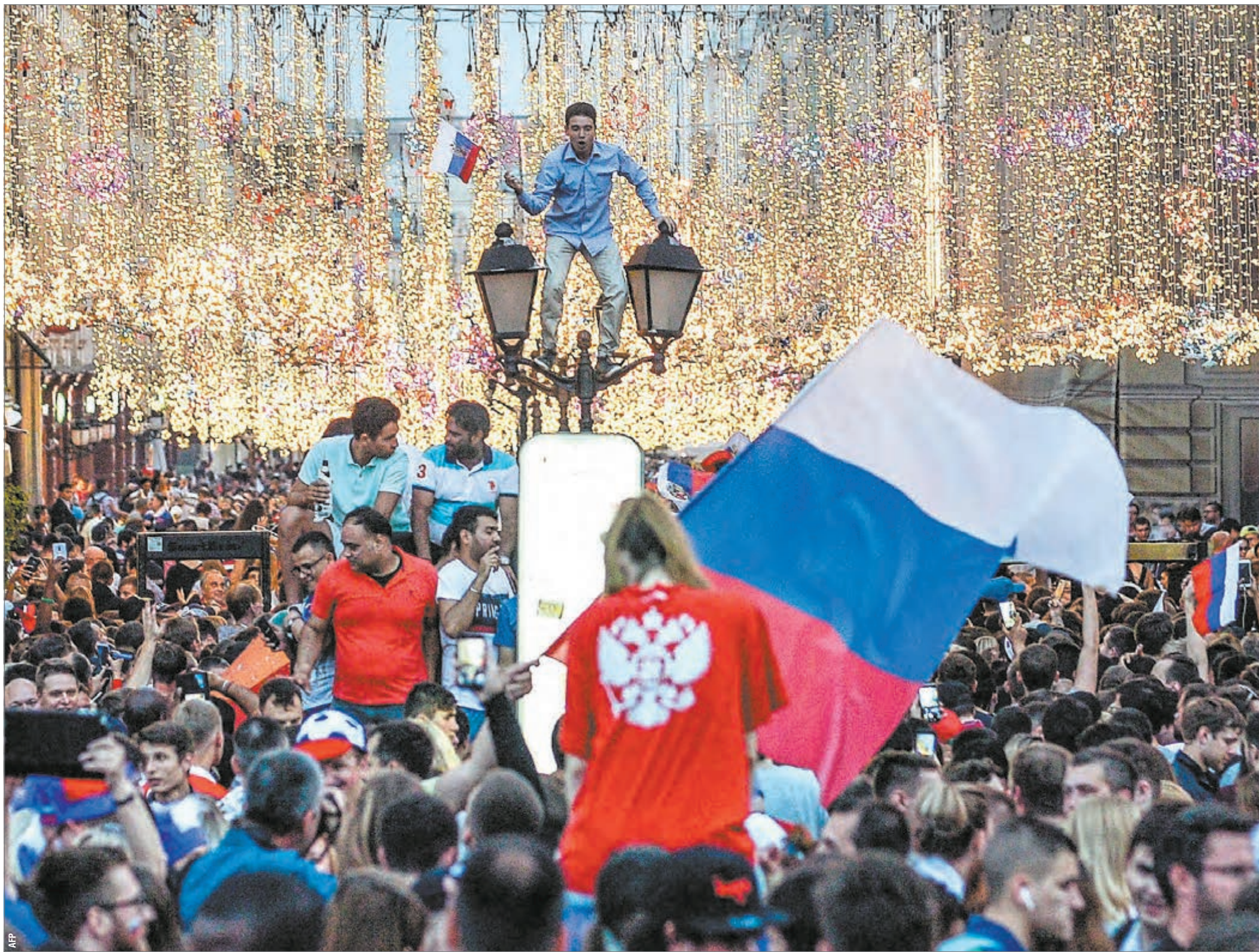
Воскресенье. Москва. Народные гулянья на Никольской улице после победы сборной России.

Сборная России подарила стране колоссальное счастье - народ после победы в 1/8 финала ЧМ-2018 над Испанией (1:1, пенальти - 4:3) гулял до утра. Футбол снова показал, что может быть нашей национальной идеей.