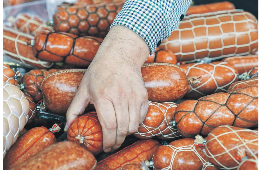
Сергей Лавочкин / Иллюстрация

«Введение требования позволит повысить доступность продукции местного производства, сократить логистические издержки и стабилизировать потребительские цены», — говорится в пояснительной записке к законопроекту.