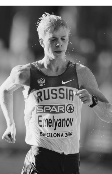
Юниор не оставил шансов более взрослым соперникам

Старт в 8 утра и термометр на отметке в 24 градуса делают