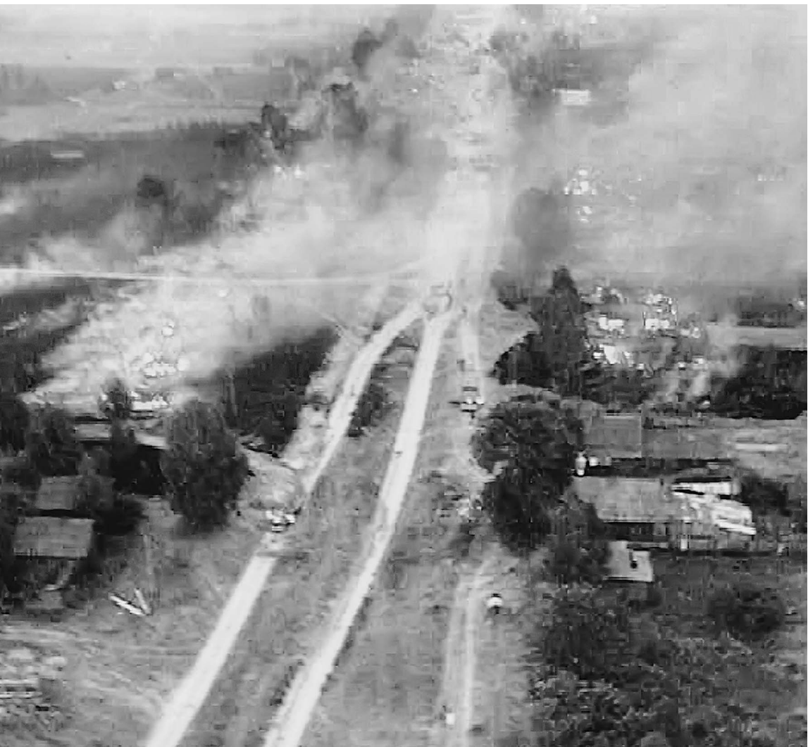
Деревня Семилово в Нижегородской области загорелась в воскресенье. Такая картина в эти дни может стать типичной во многих регионах России

Борьбой с пожарами занялись на высшем уровне