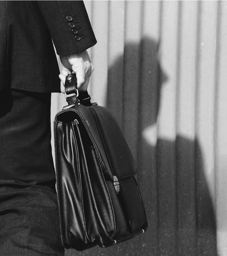
Пока что мы не знаем, что в портфеле у десятиллионной армии российских чиновников — служебные бумаги или документы на право собственности