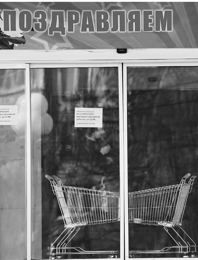
Магазин закрыт на переоценку: типичная картина на фоне низкой инфляции

За год расходы россиян на продукты выросли на 22%