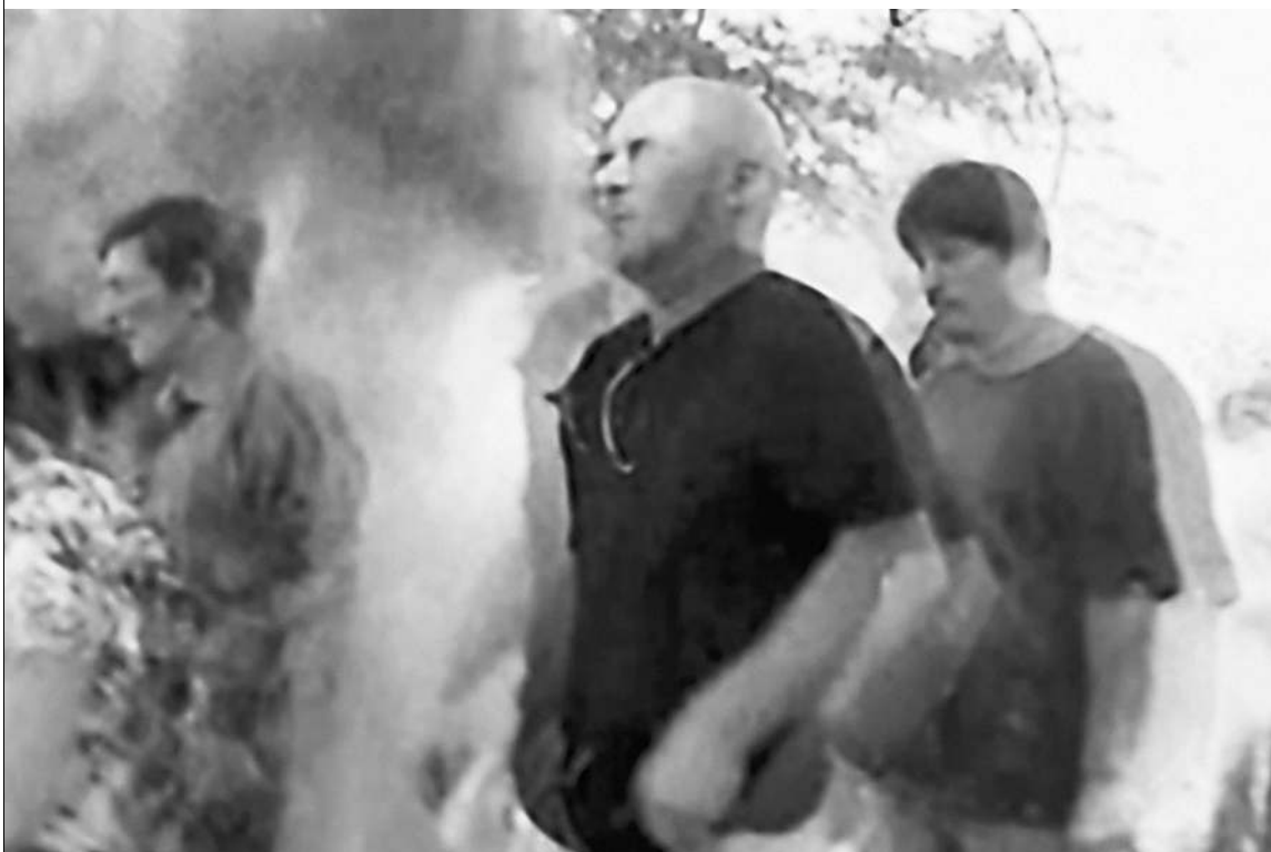
Взрывное устройство пронес кто-то из участников похоронной процессии