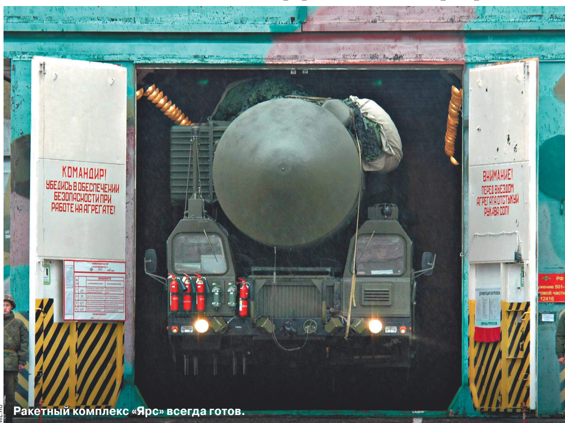
Ракетный комплекс «Ярс» всегда готов.