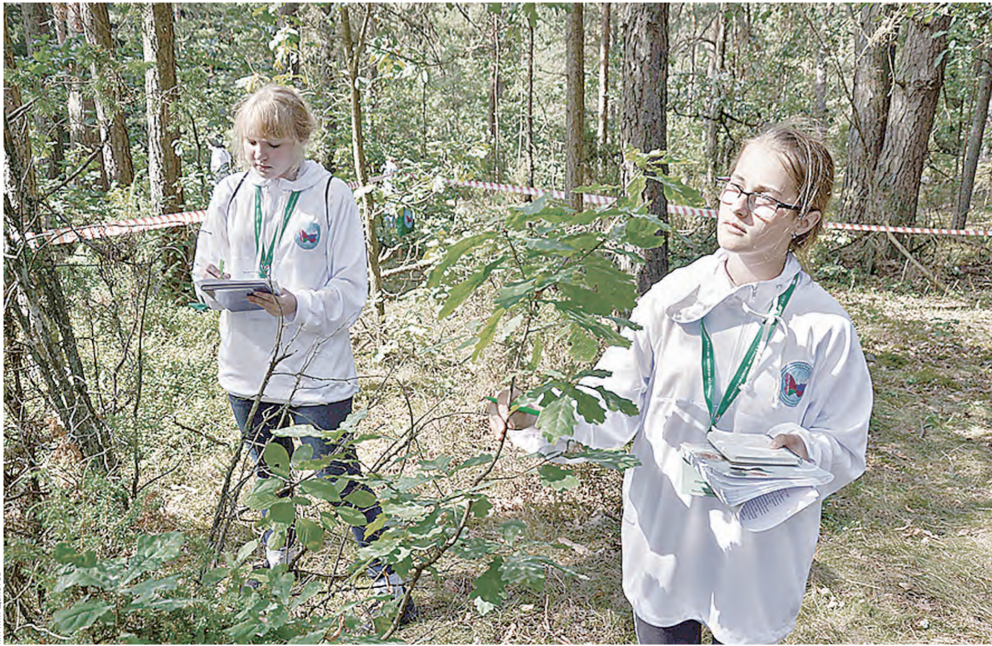
Мини-экспедиции юных экологов проходили в лесу, на лугу, у водоема или в самом озере...

Работа шла в полевых лабораториях. Это своего рода мини-экспедиции в заповедник,