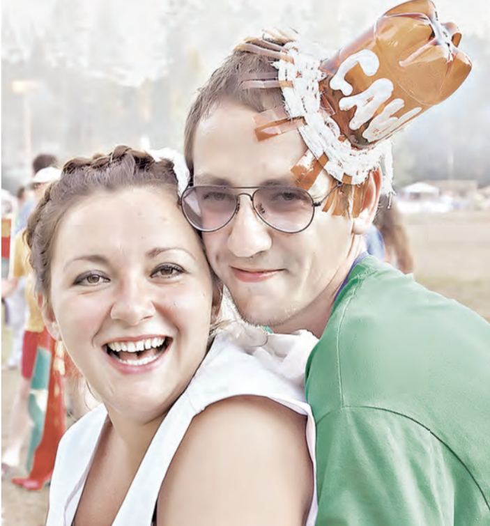
В лагерь приехали более 500 ребят из Беларуси, Латвии и России.