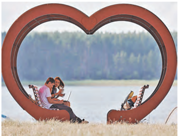
Главный смысл форума — познакомиться с новыми людьми, подружиться с ними и сделать друзьями России.

Кроме изучения лидерских навыков и умений, необходимых для успеха, участников «Селигера» ждет и большая культурно-развлекательная программа. В частности, пройдут традиционные соревнования «Селигерские игры», а один день отведен под «Туризм и приключения». Завершит «INTERSELIGER» 3 августа.