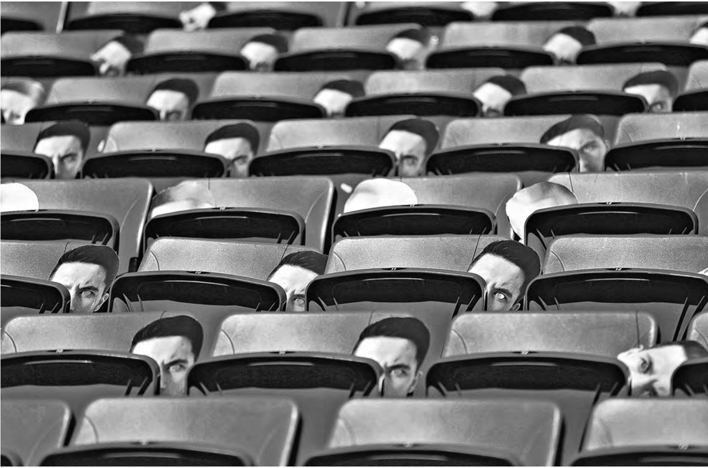
Тем блогерам, которые зарегистрировались в спецреестре Роскомнадзора, будет гарантирована анонимность. Но «ники» шифровать не будут.