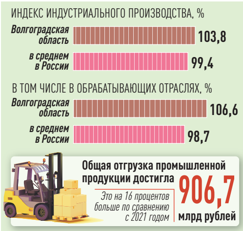
ИНФРАГРАФИКА «РГ», ИРИНА ТЕПЛОВА