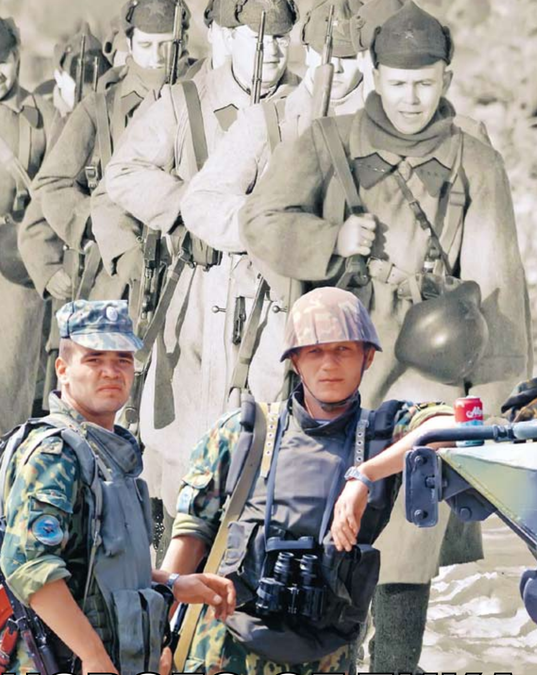
Коллаж Андрея СЕДУХА

Наконец, в-третьих, так и не удалось создать алгоритм превращения добровольца в настоящего солдата. Важнейшими элементами «профессионализации» являются приучение контрактных военнослужащих к армейской дисциплине, ответственности, а также их моральные воспитание. Можно вспомнить, например, что в британском флоте в XVIII и начале XIX века вербовка матросов вообще носила в значительной мере принудительный характер – «рекрутов» просто насильно хватали в портовых кабаках,