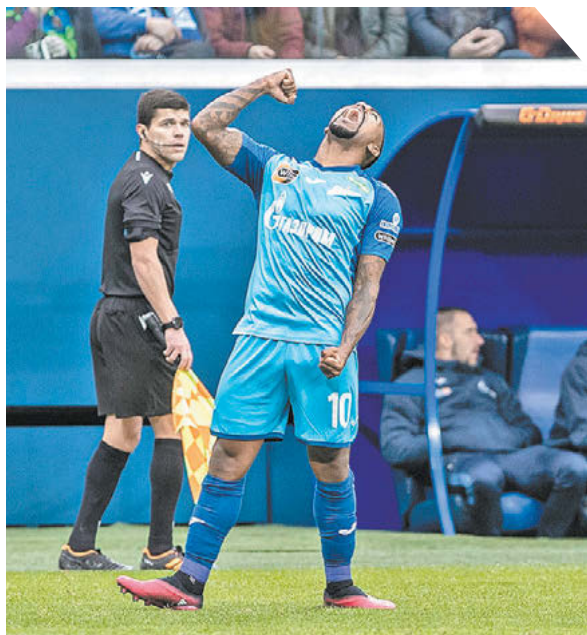
Виктор Онопко ФК «Зенит»