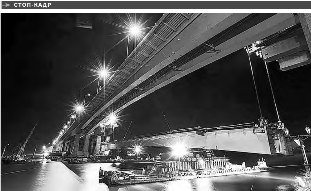
На Ворошиловском мосту в Ростове установили центральный русловой пролет. Общий вес конструкции составляет 1000 тонн, длина пролета — 125 метров, высота, на который поднимали пролет — 22 метра. Такая технология строительства моста — возведение дублера — применяется в Ростове впервые.

СВОИХ первых пациентов один из самых крупных в стране центров примет уже в январе 2017 года. Медучреждение рассчитано на 150 коек, его общая площадь 39 тысяч квадратных метров. Он будет доступен и для людей с ограниченными физическими возможностями. Министр здравоохранения республики Танка Ибрагимов отметил, что перинатальный центр будет оснащен самым современным медицинским оборудованием, врачи прошли переподготовку.