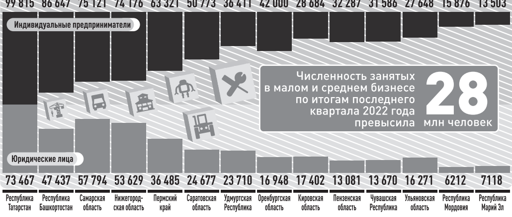
ИНФОРМАЦИЯ: РГ, СЕРГИЙ КУДЯШОВ