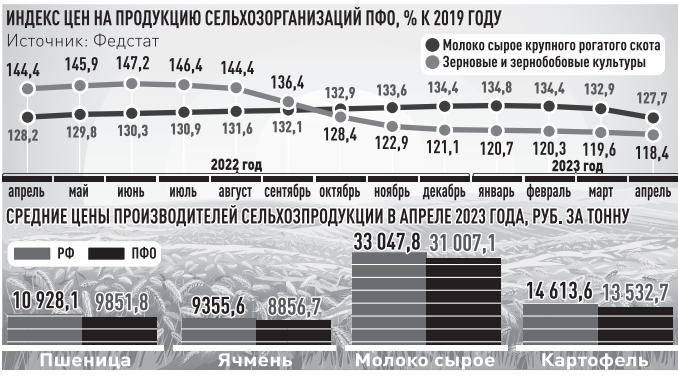
ИНФОРМАЦИЯ: РГ, СЕРГИЙ КУДЯШОВ

Ценовое давление испытывают и производители молока.