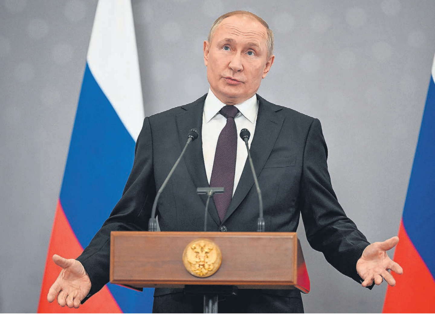
Владимир Путин не может сказать, была ли взрывчатка на зерновозе из Одессы

— Судя по тому, что вы сказали, были быбраны союзнические обязательства в рамках Североатлантического альянса, — продолжил президент. — Правильно это или нет? Я считаю, это ошибка, и за эту ошибку расплачиваются бизнес, экономика, граждане Федеративной Республики. Впрочем, с ее интересами мало кто считается, иначе не были бы подорваны «Северный поток-1» и «Северный поток-2». Это был элемент надежности: в крайнем случае их можно было бы вклю-