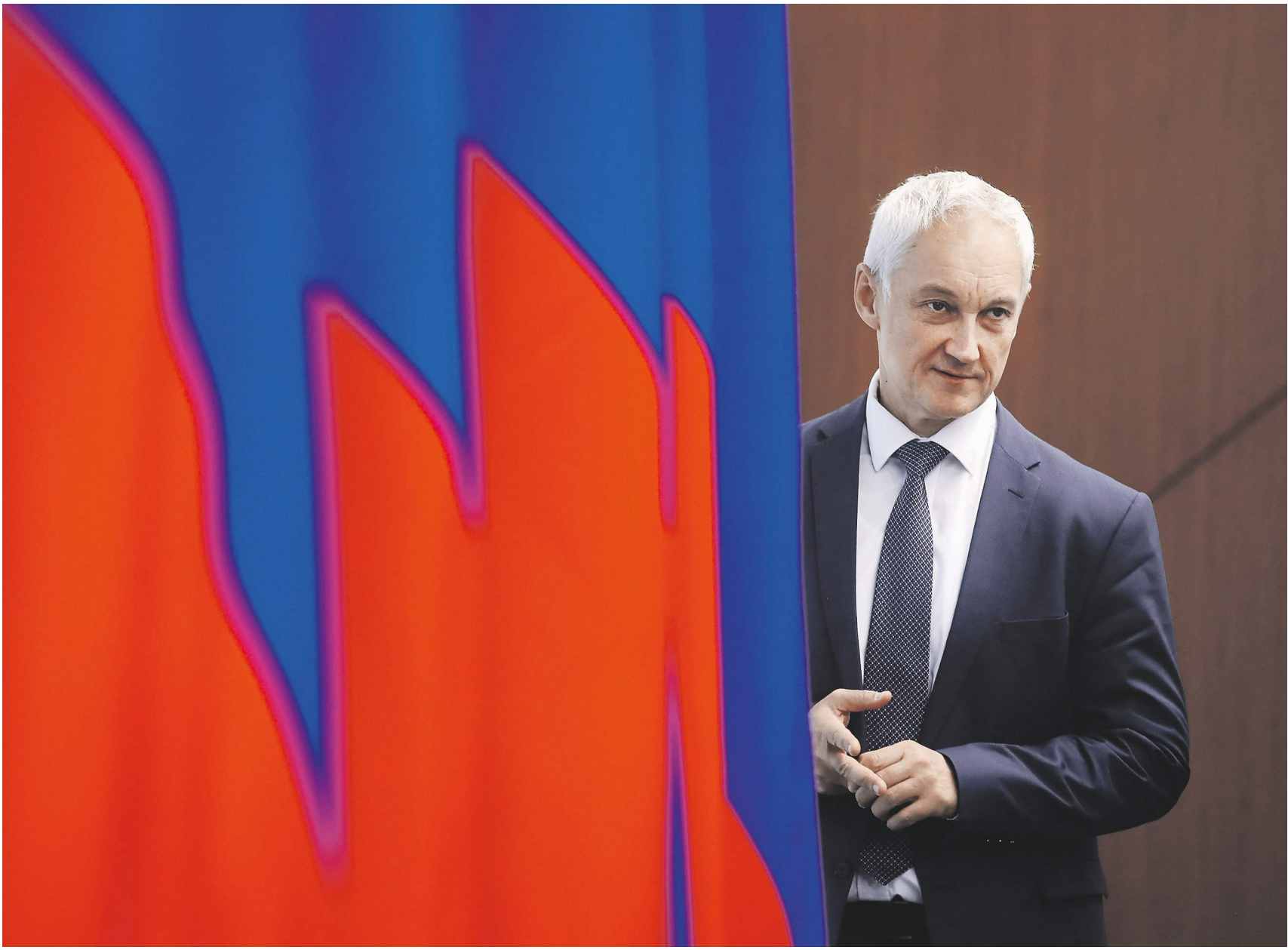
Александр Клавов | «Известия»