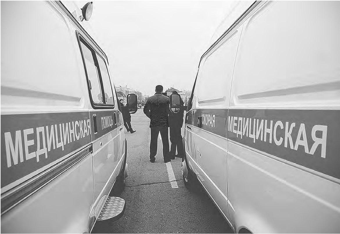
Новые автомобили скорой медицинской помощи переданы в распоряжение больниц Тульской области. Все они закуплены на средства федерального бюджета. Всего до конца года в парке медицинской техники региона появится 56 новых машин.

НОВУЮ шкалу налога на имущество физлиц приняли в регионе, чтобы избежать скачка начислений за 2015 год. Этой осенью тамбовчанам выставили к оплате суммы в пять-десять раз большие, чем прежде. Власти одумались и пересмотрели ставки. Теперь владельцы объектов с инвентаризационной стоимостью от 0,5 до 5,5 миллиона рублей заплатят от нее 0,31 процента, а не один-полтора. В четырех районах ставки еще ниже.