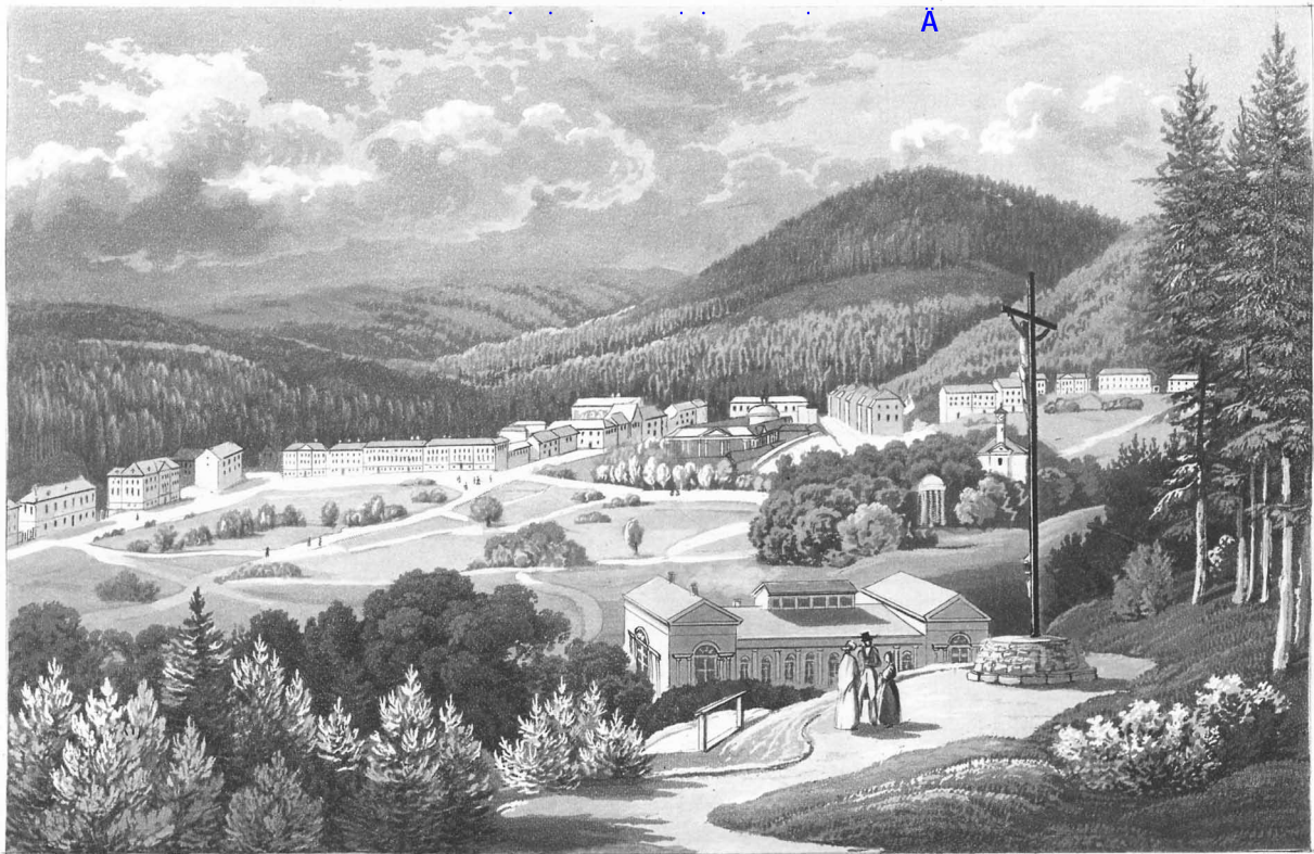
ALLGEMEINE ANSICHT VON MARIENBAD.