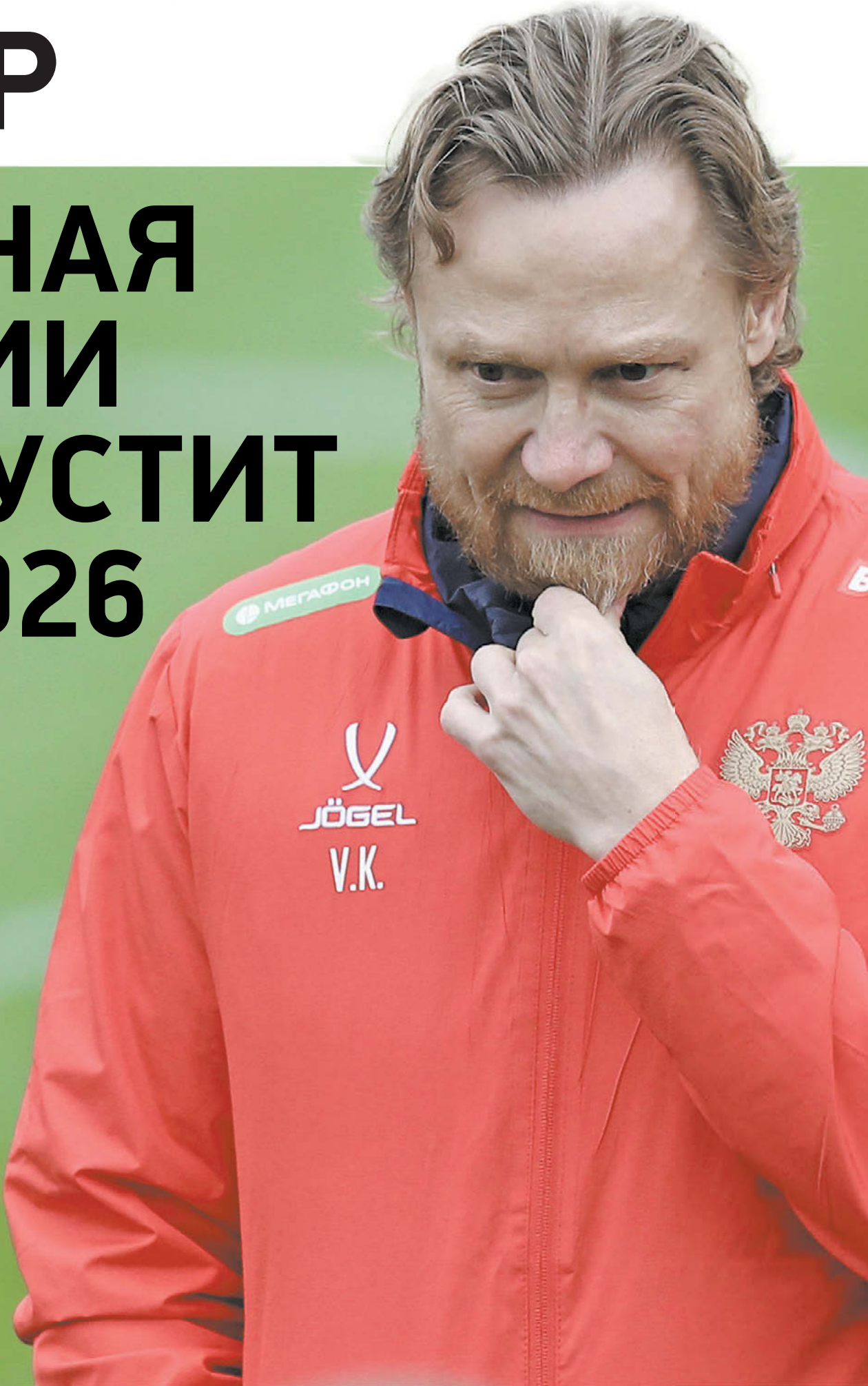
Главный тренер сборной России Валерий Карпин

Нашу команду вновь не допустили к участию в отборочном цикле крупнейшего международного турнира. Это следует из циркулярного письма УЕФА, отправленного 11 ноября президентам и генеральным секретарям федераций, входящих в Союз европейских футбольных ассоциаций