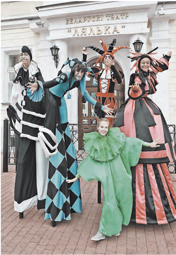
Первые на фестивале «Славянский базар в Витебске» работал «Кукольный квартал».