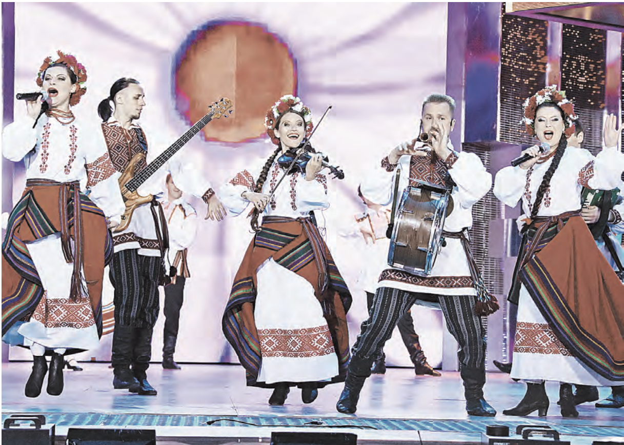
Завершал День Союзного государства концерт мастеров искусств двух стран.