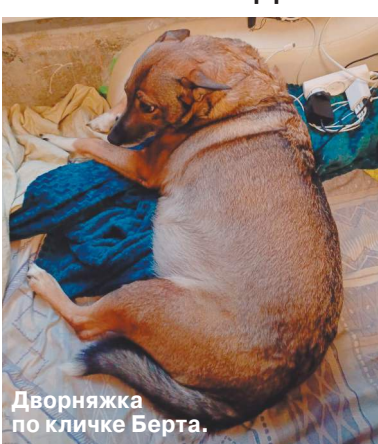
Дворняжка по кличке Берта.

Как стало известно «МК», ЧП произошло возле многоэтажки на улице Красной Казанец. Молодой человек гулял с дворняжкой по кличке Берта, причем животное было в наморднике. В это же время на прогулку с двумя собаками породы чихуахуа вышел знакомый ему с детства 58-летний житель этого же дома. Собаки сцепились, между мужчинами произошел словесный конфликт. Разозленный владелец чихуахуа завел домой питомцев и позвал на разборки мужа и сестры, с которыми проживал в одной квартире. Зять собачника — уроженец Ростовской области, грузный здоровяк — выглядел очень колоритно в казачьей форме, которую периодически надевал. Мужчины вдвоем напали на молодого человека. Агрессоры несколько раз прижали жертву холодным оружием в живот, ударили