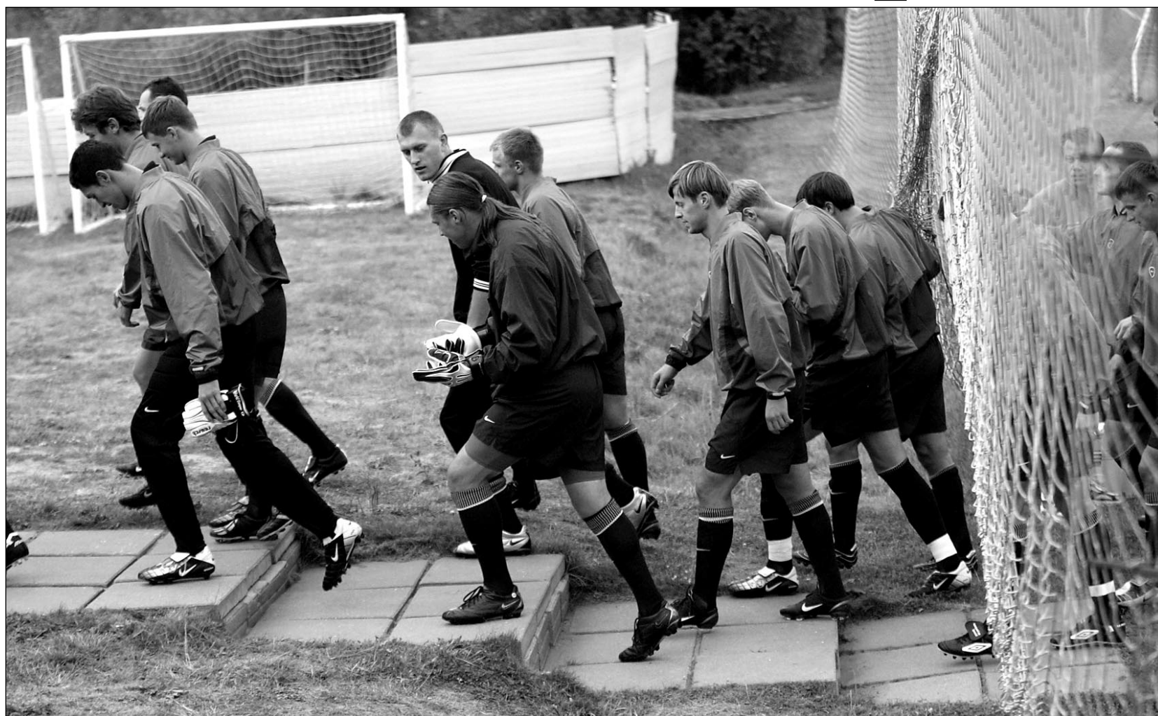
Вчера. Бор. Тренировка сборной России. Еще не все приехали на первый сбор, но уже очевидно: на европейское первенство в Португалии будет пробиваться заметно обновленная команда.

Коллеги из популярного немецкого журнала Kicker сообщили нам, что сейчас Лотар Маттеус с семьей находится в отпуске, а его мобильный телефон отключен.