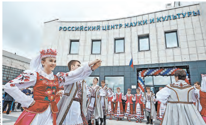
Российский центр науки и культуры в Бресте — уже второй в Беларуси.

Российского спикера поддержал председатель Палаты представителей Национального собрания Беларуси Владимир Андрейченко. Он не сомневался в том, что центр будет работать на укрепление дружбы, сотрудничества и взаимопонимания между нашими странами. И позволит всем желающим поближе узнать о духовном и материальном потенциале России. «Символично еще и то, — считает Андрейченко, — что в годы войны мы были вместе с россиянами и сегодня мы вместе».