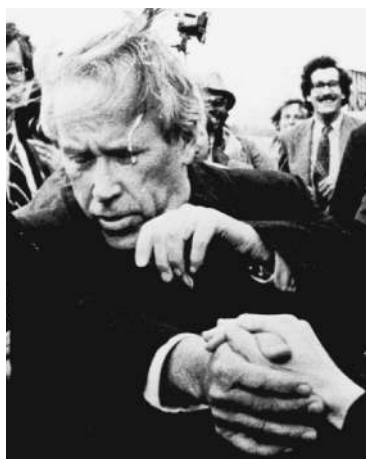
Тот самый ДЖЕКСОН

И уж тем более — от Тома Лантоса. В последние годы этот человек был едва ли не самым яростным критиком России в конгрессе. Это он требовал исключения Москвы из «большой восьмерки», обвинял «путинский режим» за «преступления в Чечне», арест Михаила Ходорковского, «имперскую политику» на постсоветском пространстве. А тут вдруг из «ястреба» превратился в «голубя».