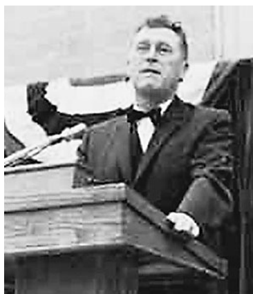
Тот самый ВЭНИК