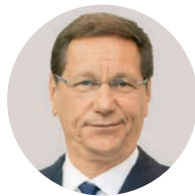
А. Д. Жуков Первый заместитель председателя Государственной думы