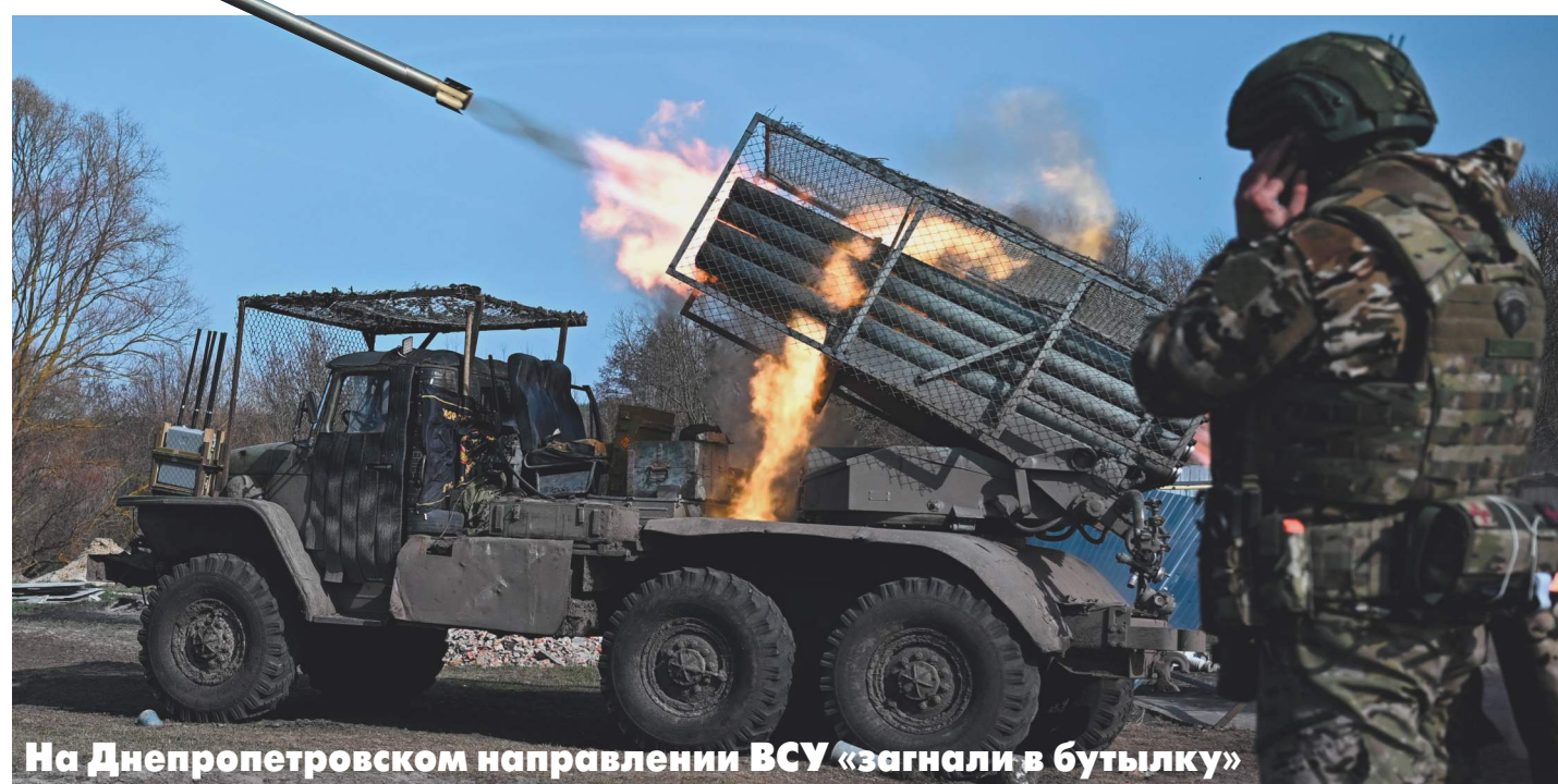
На Днепропетровском направлении ВСУ «загнали в бутылку»

Заход российских подразделений в Днепропетровскую область станет стратегическим поражением для киевского режима. Об этом 9 июня написала газета The Times. Бывший подполковник ВС США Дэниэл Дэвис