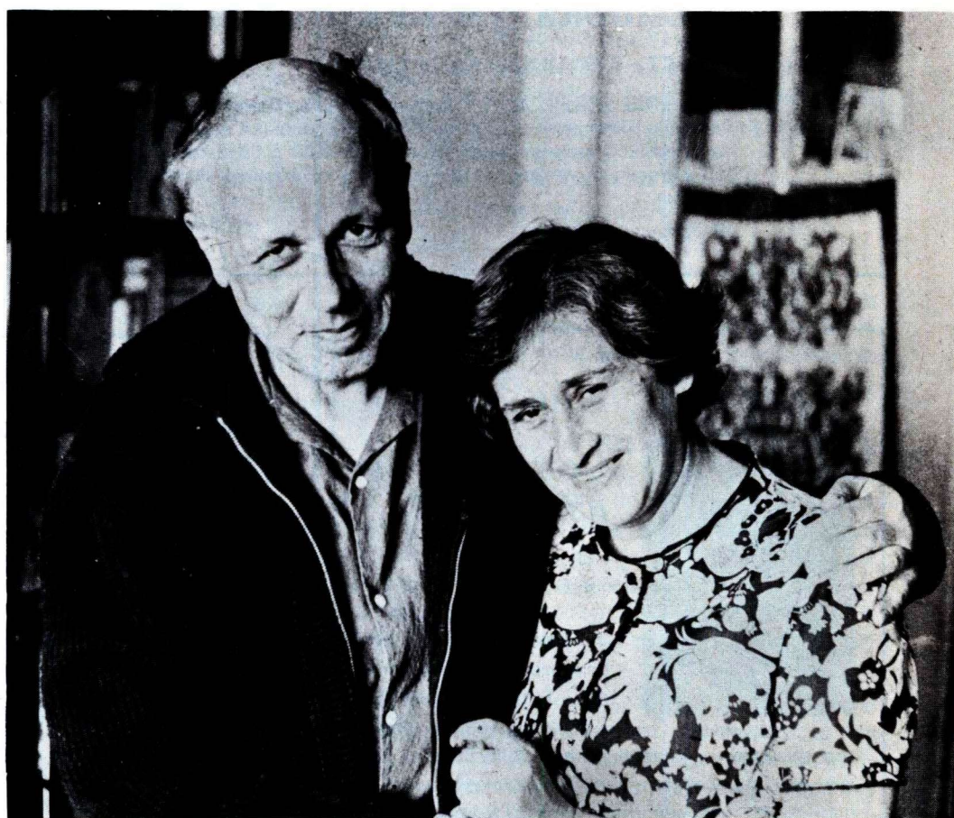
А. Д. Сахаров с женой Е. Г. Боннэр

ЕЖЕМЕСЯЧНЫЙ ОБЩЕСТВЕННО-ПОЛИТИЧЕСКИЙ ЖУРНАЛ