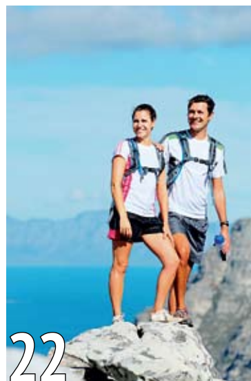
В помощь сердцу