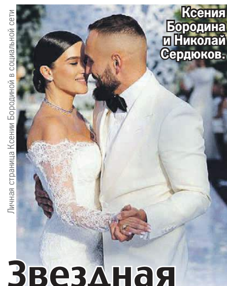
Ксения Бородина и Николай Сердюков.