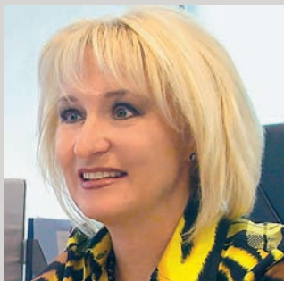
ПРЕДСЕДИТЕЛЬ ПЕРВОГО РУССКОГО КОРПОРАЦИИ РАЗВИТИЯ «ЗОЛОТОЕ КОЛЬЦО»