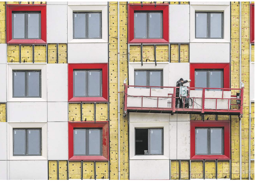
Константин Кошкин | «Известия»