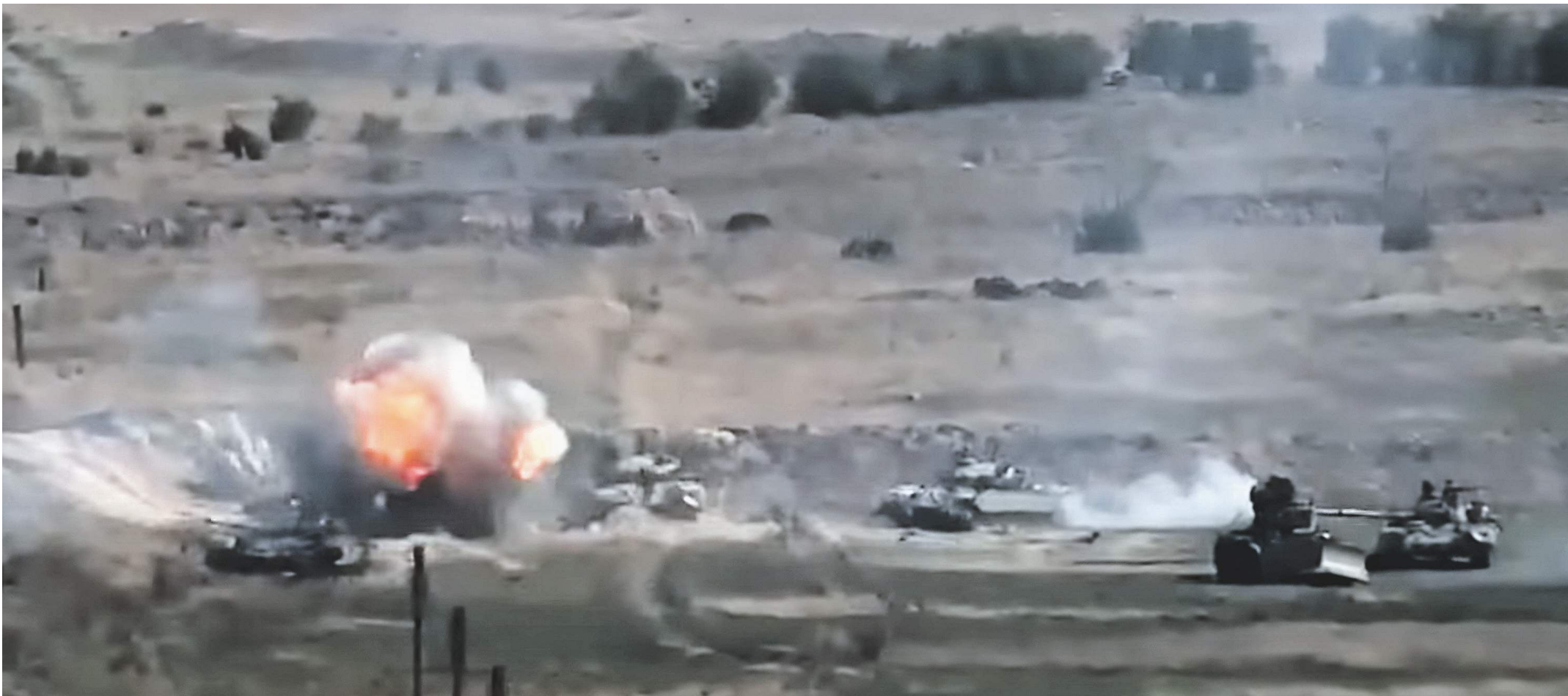
Очередное обострение в Нагорном Карабахе рискует перерасти в полномасштабную войну (на фото — обстрел позиций азербайджанской армии со стороны Армении, 27 сентября)

Армения и Азербайджан вновь оказались в шаге от войны