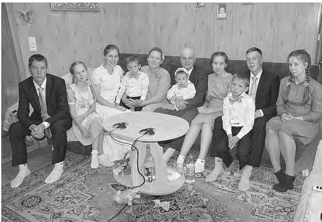
ПРЕСС-СЛУЖБА ПРАВИТЕЛЬСТВА АЛТАЙСКОГО КРАЯ

Многодетная семья потратит президентские выплаты на строительство дома