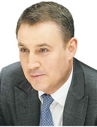
Дмитрий Патрушев, министр сельского хозяйства РФ:

ных консервов до рыбных деликатесов. Сейчас в области разгар уборочной кампании. Собрано уже более 212 тысяч тонн картофеля. Рассыпчатую картошку любят не только астраханцы, ее отправляют и в другие регионы. Последние несколько лет область занимает первое место в России по выращиванию овощей. В этом сезоне планируется собрать более двух миллионов тонн овощебахчевой продукции и картофеля. Аграрии отметили, что при очевидных успехах ситуация в сельском хозяйстве сложилась непростая. Сохраняются логистические риски, ведь оборудование на предприятиях перерабатывающей промышленности в основном иностранного производства. Оно не вечно и требует технического обслуживания. Нужно подумать и о сельхозтехнике. Весной с поставками комплектующих были проблемы. Но сейчас уже поняли, как надо обслуживать импортную технику. И главное, растет собственное производство. Государство не осталось в стороне от проблем сельхозпроизводителей. —Финансовая поддержка АПК была увеличена на 35 процентов, на выполнение госпрограммы уже направили свыше 380 миллиардов,—сказал премьер-министр Михаил Мишустин. ●