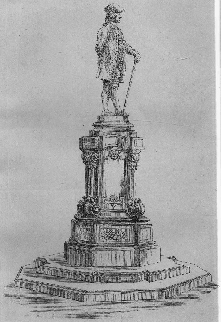
Padova Lit. Ant. Fraconeri Piazz. dei frutti. 570. DISEGNO DEL MONUMENTO CHE SI ERIGERÀ IN VENEZIA