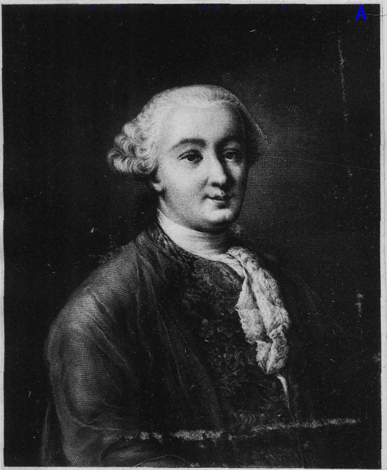
· CARLO GOLDONI ·